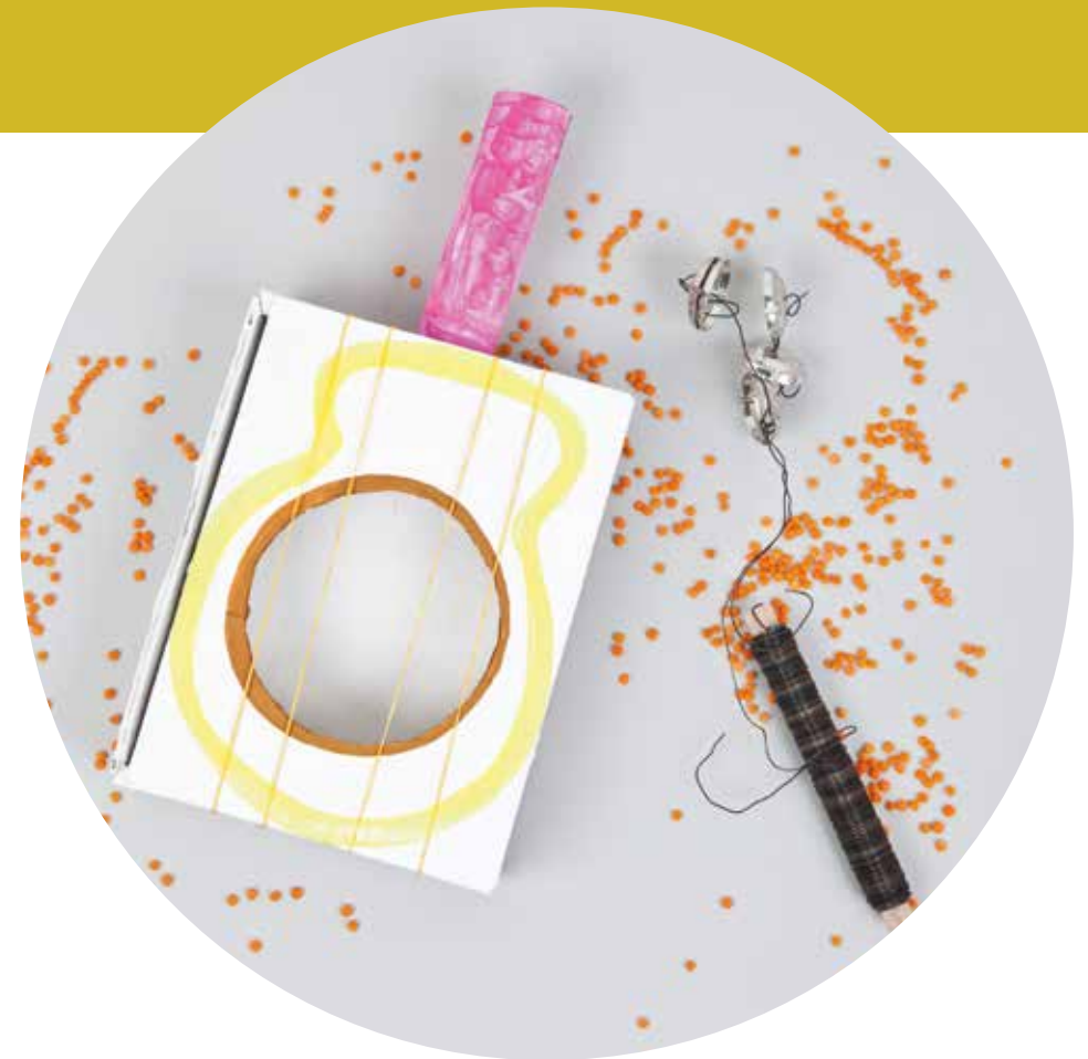
Eins, zwei, drei – und schon spuckt die selbstgebaute Gitarre Töne aus.