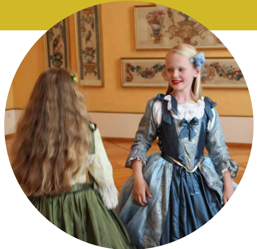
Mieder und Reifrock, Schönheitspflästerchen und Puder: bereit für das Fest bei Hof.