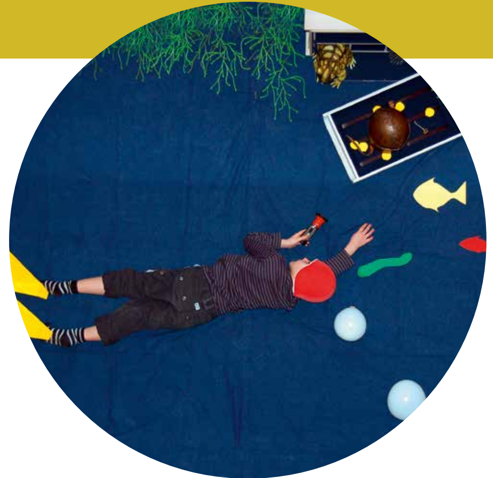
Tiefseetaucher: Unter der Von-Oben-Kamera lässt sich die Unterwasserwelt ganz ohne Sauerstoffflasche erkunden!