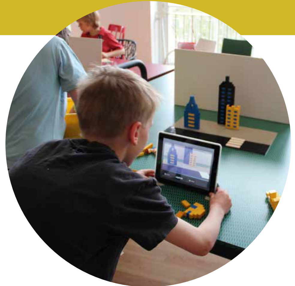
Lebendige Stadtplanung: Mit LEGO-Steinen und Tablet werden Visionen wahr.