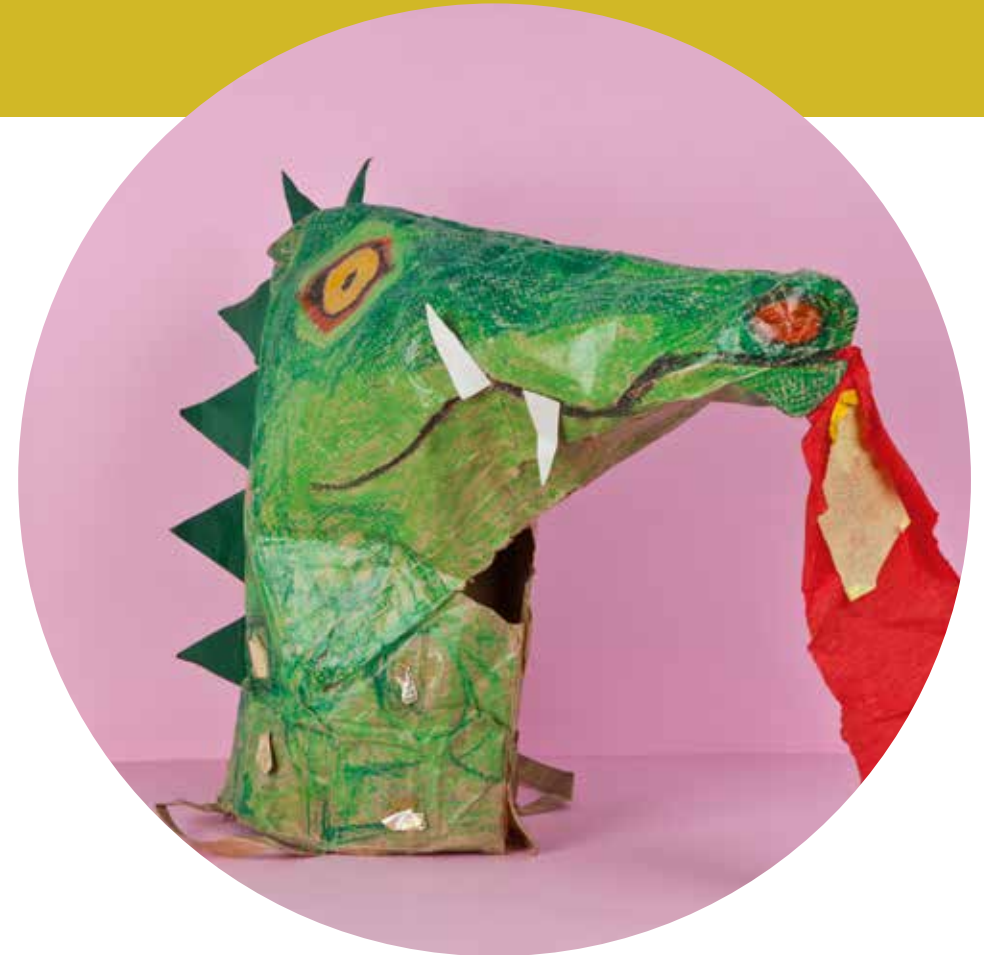
Drachen, Roboter oder lieber Medusa: Ideen finden sich in den Sammlungen.